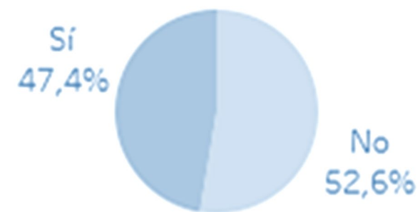
Gráfico nro. 1 Víctima de Cyberbullying

La estimación de la prevalencia de ciberbullyng declarada en jóvenes entre 15 y 29 años en 2021 en Chile es del 47%